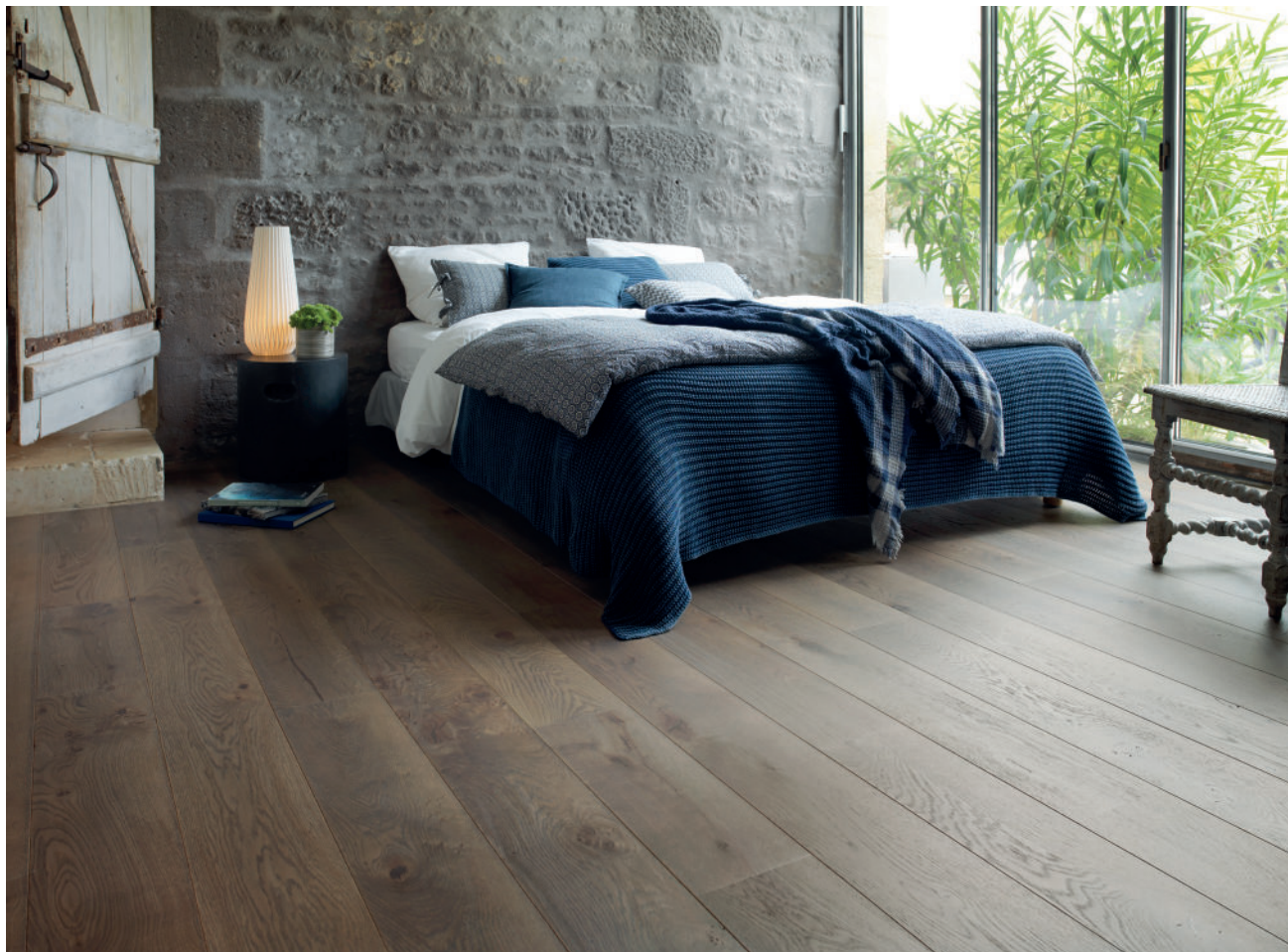
Parquet Panaget | Chêne | Zenitude | Argile | Diva 184

Inspiré des céramiques non vernissées, Argile, verni gris-brun, laisse apparaître la beauté naturelle du bois pour un sol très décoratif et unique. Le parquet se coordonne, ici, parfaitement à l'esprit nature de la chambre et au linge de lit bleu pétrole, couleur idéal pour cette pièce car synonyme de détente et de bien-être. Dès l'entrée jusqu'au séjour, son authenticité apaise et donne envie d'y marcher pieds nus.