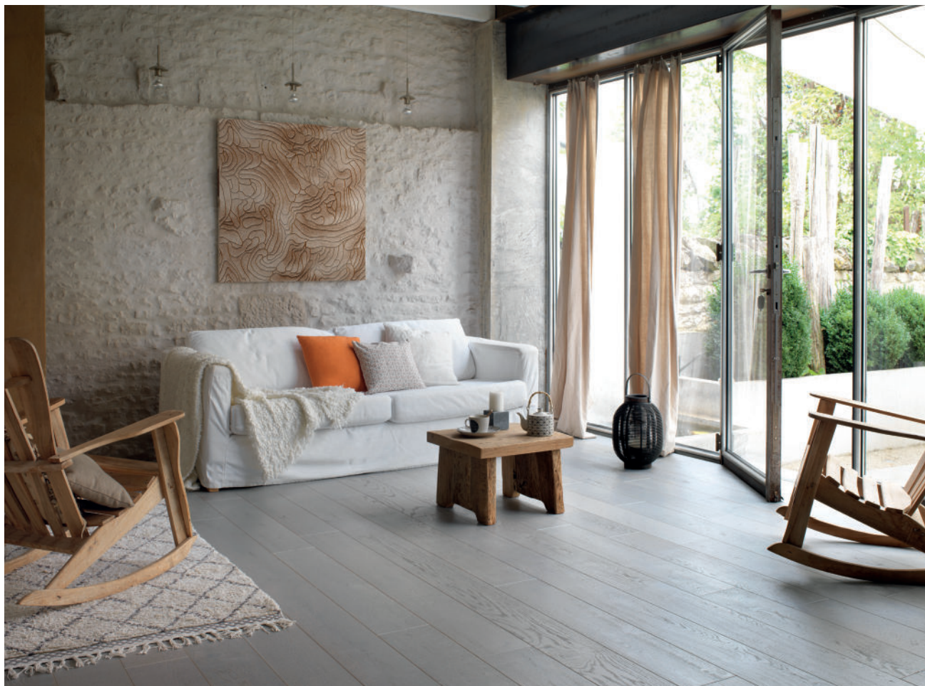
Parquet Panaget | Chêne | Zenitude | Cendre | Diva 184

Subtile alternative aux teintes naturelles, Cendre s'inspire des pontons en bois grisé et éclairci par les intempéries. Parfaitement dosée, cette finition laisse transparaître toutes les spécificités du parquet en chêne huilé. Vivement conseillée dans une pièce baignée de lumière, elle magnifie les gris et réchauffe résolument l'espace. Jouez le contraste par des touches de couleur avec les accessoires.