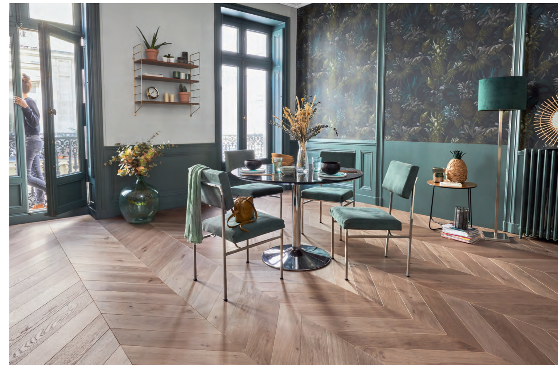
Parquet Panaget | Chêne French oak | Authentique Authentic | Café crème | Point de Hongrie 139 Chevron 139