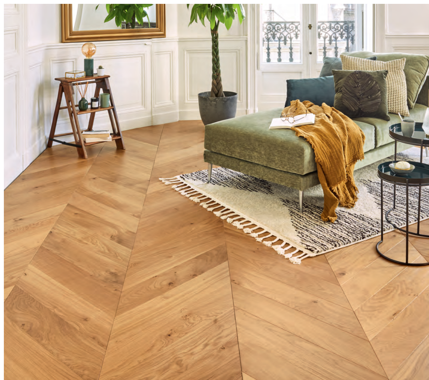
Parquet Panaget | Chêne French oak | Zenitude | Miel | Point de Hongrie 139 Chevron 139

Made from French Oak, a wood renowned for its fine appearance, Chevron 139 is available in three different matt finishes (Bois flotté, Café crème and Miel) and one oiled finish (Sable). Aesthetically pleasing thanks to the distinctive Authentic and Zenitude wood, it adds visual interest and charm to any space. Regardless of the finish, Chevron 139 wood floors are a chic and cosy choice. Blending seamlessly with both classic and contemporary interiors, they will appeal to fans of both the old and the new.