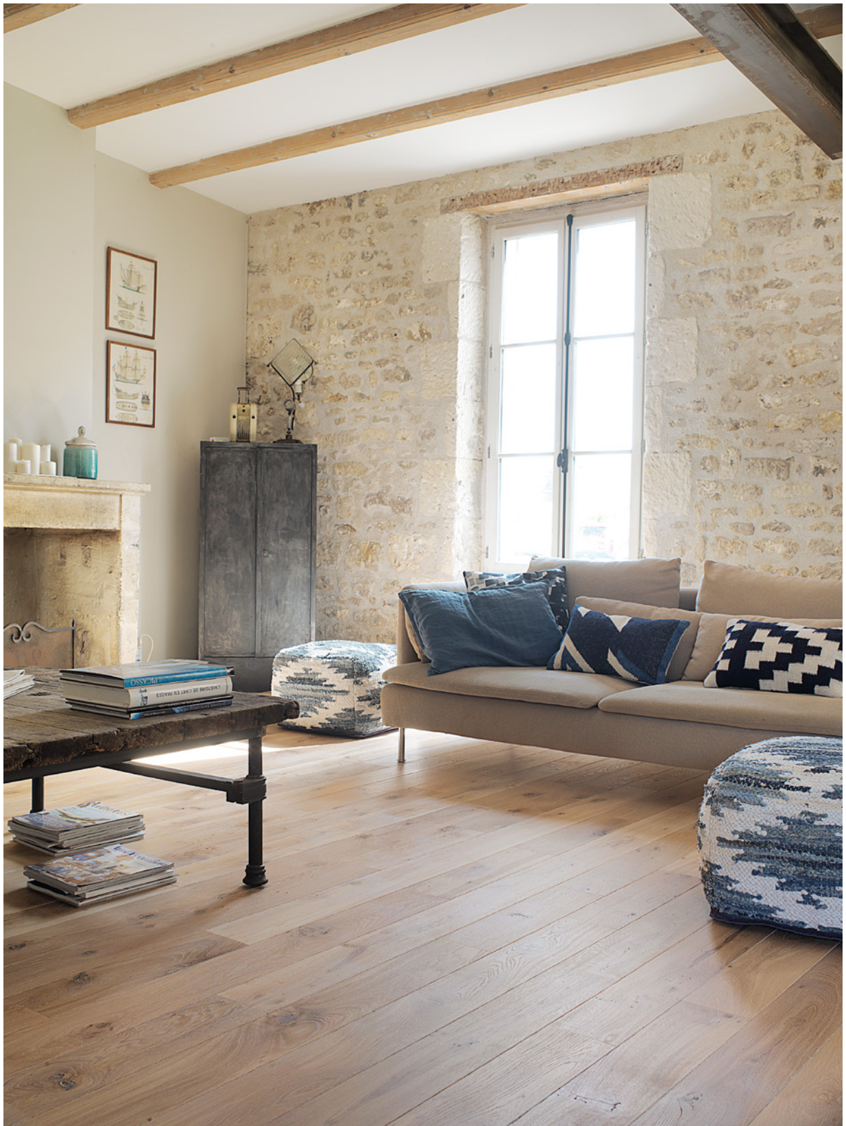
Parquet Panaget | Chêne | Origine | Sable | Diva 139

A la fois doux et marqué par les fortes singularités* du chêne qui lui confèrent son caractère authentique, Origine Sable sublime la beauté du chêne de France. Cette finition brossée huilée, subtilement patinée et blanchie, crée une sérénité immédiate, propice à ressentir la chaleur du bois sous les pieds. Enfin, Sable porte également des chanfreins vieillis, propres à la gamme Origine.