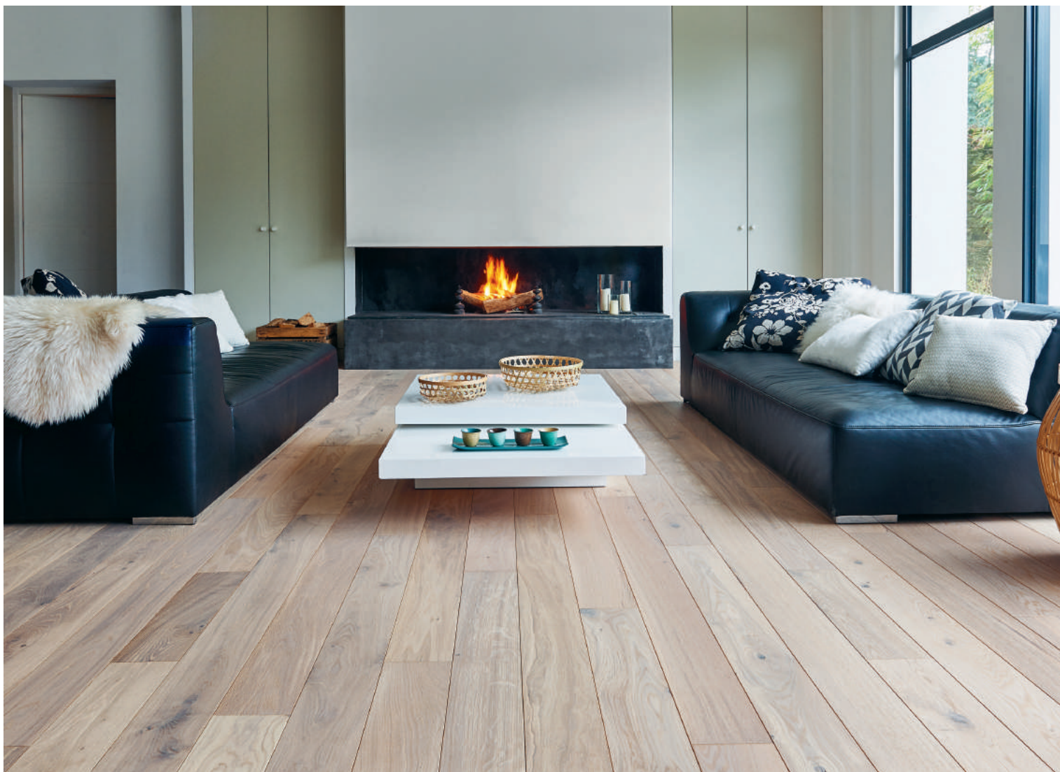
Parquet Panaget | Chêne | Zenitude | Huile blanche | Otello 139

Dans ce vaste salon contemporain baigné de lumière naturelle, l'harmonie repose ici sur un ensemble décliné dans une palette ton sur ton, en accord avec le mur vert olive et réhaussé par des touches noires.