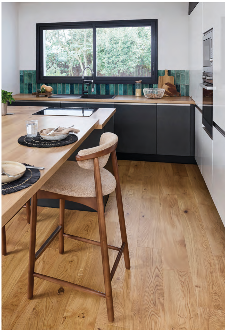
Chêne | Zenitude | Topaze | Diva 184