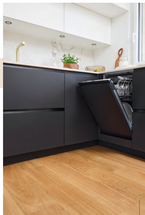
Chêne | Classic | Topaze | Diva 184

Pour les parquets huilés : après la pose et une à deux fois par an, appliquez l'huile naturelle d'entretien Panaget sur l'ensemble de la surface parquetée et ce quelle que soit la teinte de votre parquet. Cet entretien spécifique régulier permettra de régénérer la couche protectrice et de lui garantir un aspect naturel et chaleureux.